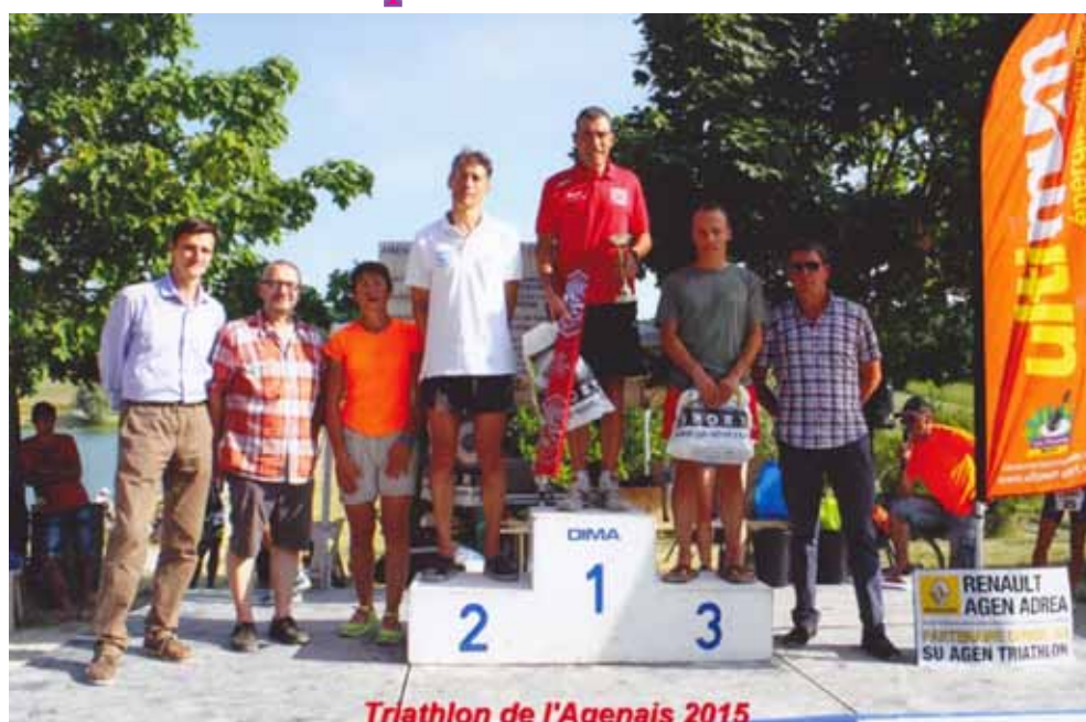
Triathlon de l'Agenais 2015

Résultats des Championnats de France des clubs sportifs de la Défense