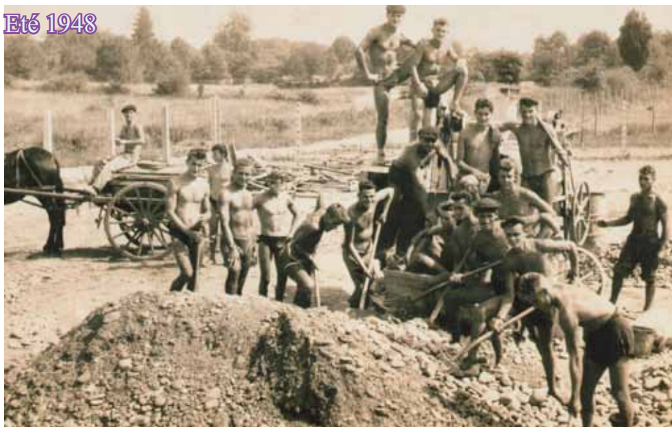
Extrait du journal l'ECLAIR (édition de PAU mardi 27 octobre 2015)